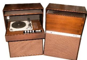
AUTOVOX - complesso stereo SONALI – 1964

Attività del gruppo “Piemonte/Valle d'Aosta” – Informazioni su: Scienza – Tecnologia – Industria – Cinema - Attualità.