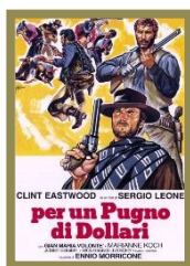
Storia del Cinema - Capitolo 36 – Western 5° puntata di Giovanni Orso Giacone