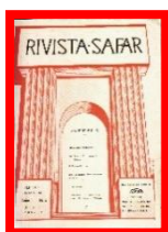
L'impianto di Televisione S.A.F.A.R. alla Fiera di Milano – 1933