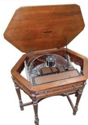
Atwater Kent - “KIEL TABLE RADIO” - Telaio 55 C - U.S.A. 1929