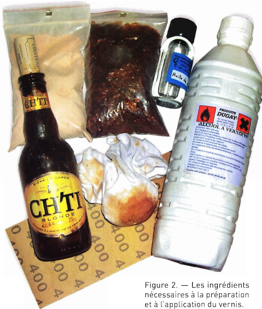
Figure 2. — Les ingrédients nécessaires à la préparation et à l'application du vernis.

sionne à sa main. Pour travailler les angles, arranger le tampon en faisant des pliages. Une fois utilisés, enfermez-les dans une petite boîte hermétique, afin de conserver leur humidité.