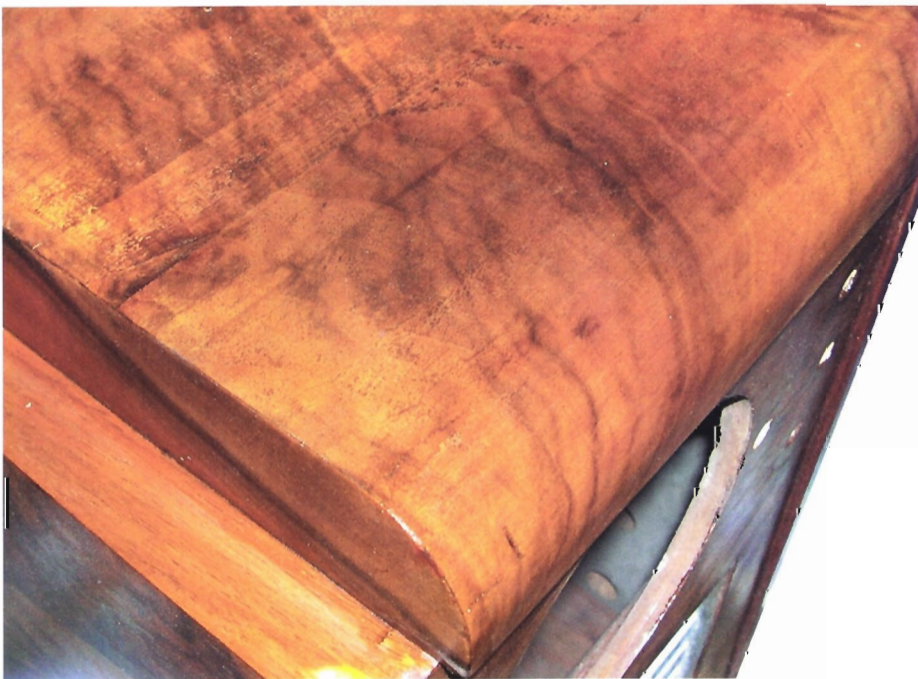
Figure 5. — Détail du même bois, après vernissage.

Cette manœuvre sera poursuivie jusqu'à l'entière couverture de la surface à traiter. L'opération de ver-