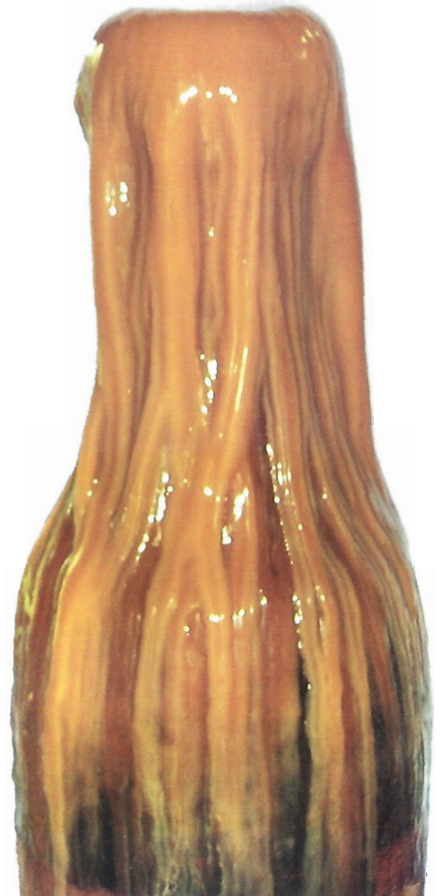
Figure 6. — Bouteille de vernis.

Un professionnel obtient un bon rendu au bout de deux à trois passes alors qu'il faudra cinq à huit passes pour les débutants que nous sommes pour la plupart.