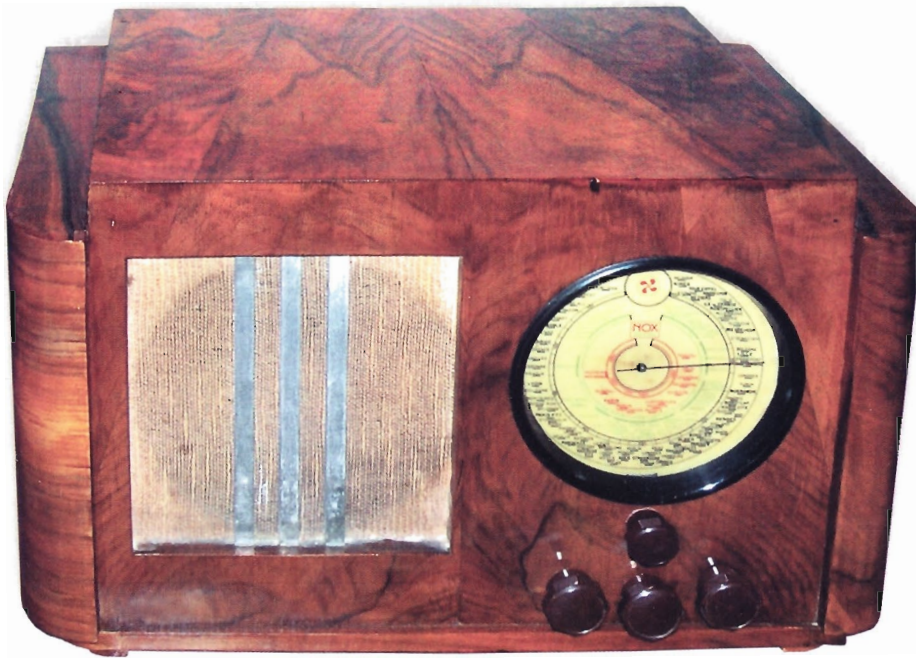
Figure 7. — Un poste Nox B400 de 1937 après vernissage.

sages du tampon. Il faut surveiller l'homogénéité de la passe en regardant en biais sous la lumière. On ne doit pas discerner de vagues ou de rebords. Si c'est le cas, il faudra passer et repasser pour chauffer à nouveau et étaler le vernis sans relief.