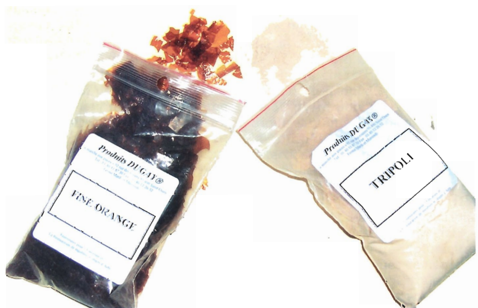
Figure 8. — Des produits bien utiles pour le vernis au tampon.

www.laverdure.fr/GOMMES-RESINES.../gommes-laques/f14/sf111