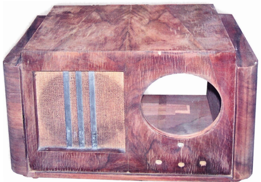
Figure 3. — La caisse du Nox préparée, prête à vernir.

étaler la charge. Dans ce cas il faudra changer de tampon pour continuer le vernissage car, même si elle est très fine, cette poudre est très