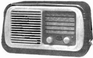
L. 25.000 mobile in materiale plastico