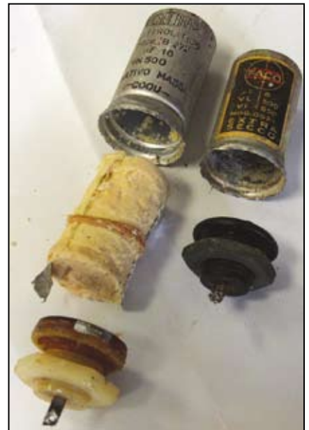
Ricostruzione di un condensatore elettrolitico.