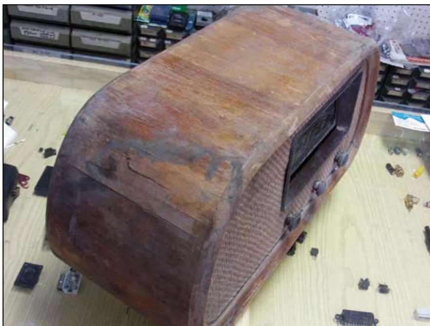
Lo stato di disfacimento dell'impiallacciatura.

Nel tentativo di mantenere la più stretta originalità dell'assemblaggio, si è provveduto a ricostituire la solidità della filettatura tramite "recoil", con filo armonico di un decimo di millimetro di diametro. La ghiera è stata poi nuovamente riavvitata con cura nella sua sede, sino a calibrare la luce giusta tra le armature della parte fissa e quella mobile; le tre sfere mancanti sono così state rimesse in sede. La funicella della sintonia è stata sostituita. Anche il telaio è stato opportunamente liberato dalla ruggine, riportandolo all'aspetto originale dell'alluminio.