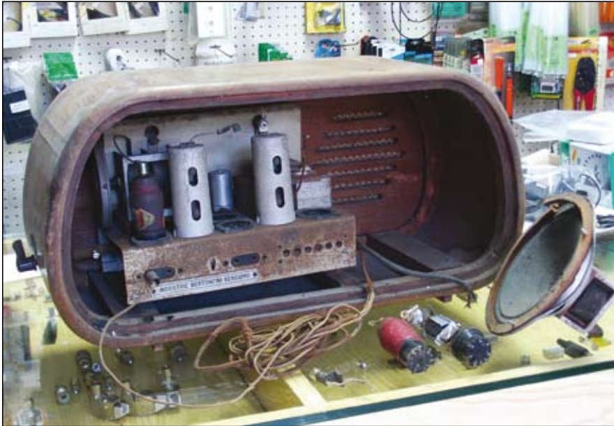
Come si presentava la radio prima del restauro

cale) e misurando all'uscita dei trasformatori di media frequenza, con un voltmetro a valvola della Orion Electronics. Per poi mettere in passo l'oscillatore tramite frequenzimetro. Poi, l'accordo dei circuiti di ingresso (Onde Corte 6 - 16,6 MHz; Onde Medie 500 - 1500 kHz) sulla parte alta e bassa della scala ed in gamma onde medie e corte, tramite l'ausilio di generatore di frequenza, controllando che, lungo l'escursione permessa dal condensatore variabile, la differenza dei 468 kHz, tra la frequenza dell'oscillatore lo-