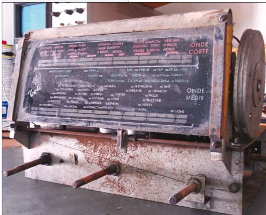
Vista frontale dello chassis, prima del restauro. La scala parlante è pressochè intatta.

Con una utile misura sul primario e sul secondario del trasformatore d'uscita e sulla bobina del cono dell'altoparlante, si è constatato la continuità dei relativi avvolgimenti. L'unica parte sana dei questo setto-