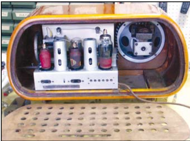
Il telaio visto da sotto.

Infine è stato ricostruito lo schienale, partendo da una foto.