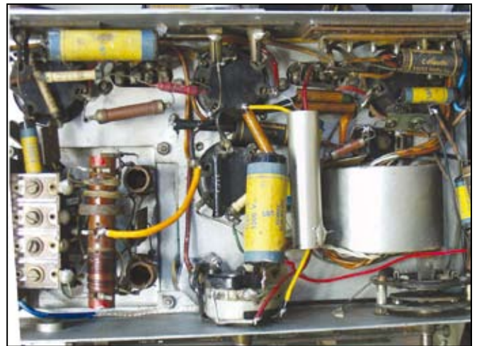
Il telaio visto da sotto.